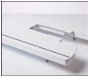
Table d'extension extra-large

Recommandée pour toutes les applications nécessitant une plus grande visibilité. Sa large ouverture permet divers positionnements de l'aiguille à gauche et à droite.