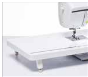
Table d'extension extra-large

Agrandissez votre plan de travail avec cette table d'extension extra-large. Idéale pour les ouvrages de quilting et de couture de grande taille. La table dispose d'une règle et d'un espace de rangement pour votre genouillère.