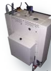
Générateur avec bache (option)