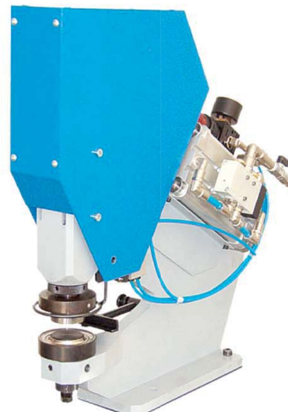
Modèle J 25