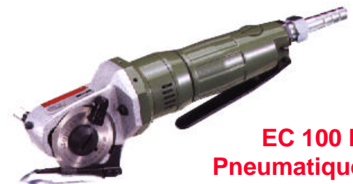
EC 100 P Pneumatique