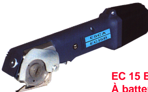
EC 15 B À batterie