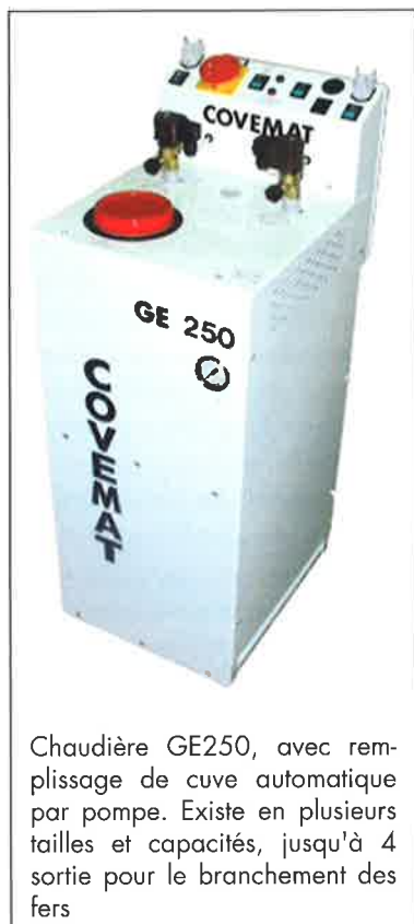
Chaudière GE250, avec remplissage de cuve automatique par pompe. Existe en plusieurs tailles et capacités, jusqu'à 4 sortie pour le branchement des fers

Pour arriver à cela le bureau d'étude privilégie une fabrication rationnelle et optimisée tout en sélectionnant des composants électriques à consommation maîtrisée.