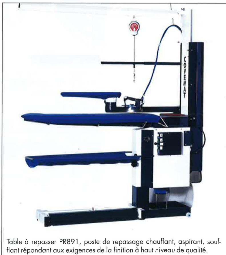
Table à repasser PR891, poste de repassage chauffant, aspirant, soufflant répondant aux exigences de la finition à haut niveau de qualité.

Covemat, dispose d'un département R&D qui s'attache à faire évoluer constamment ses produits. L'un des axes des dernières évolutions est la réduction de la consommation énergétique.