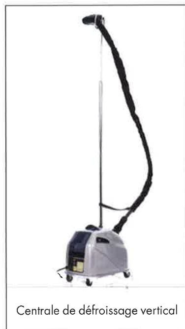
Centrale de défroissage vertical

Covemat a fait le choix de s'appuyer sur les compétences techniques de ses revendeurs régionaux pour