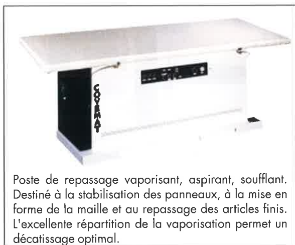
Poste de repassage vaporisant, aspirant, soufflant. Destiné à la stabilisation des panneaux, à la mise en forme de la maille et au repassage des articles finis. L'excellente répartition de la vaporisation permet un décatissage optimal.

Les moteurs utilisés sont notamment des moteurs à haut rendement qui permettent de réduire