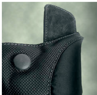
Courroies de transport