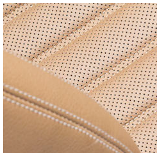
Sièges de voitures