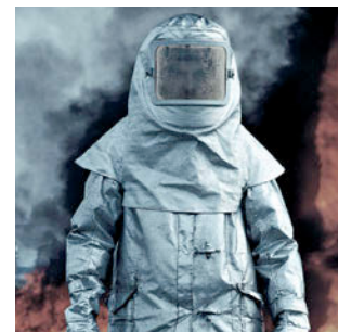
Vêtements de protection