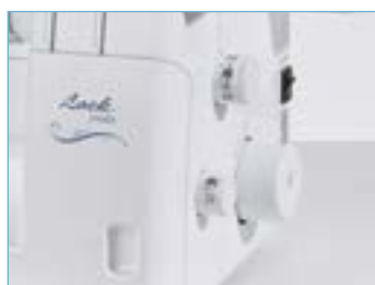
Accès simplifié aux réglages