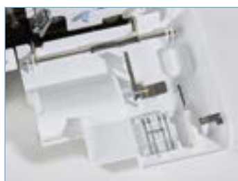
Rangement astucieux des accessoires