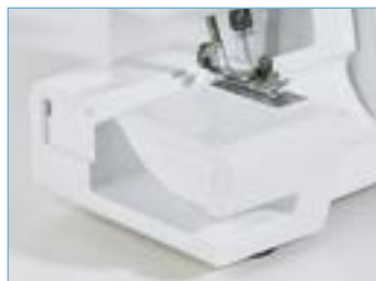
Bras libre et plan de travail extra-plat